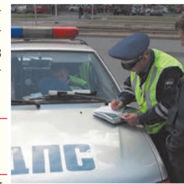
ОГИБДД Ухты

Сотрудники ОГИБДД Ухты совместно с судебными приставами-исполнителями составили 28 протоколов об административных правонарушениях. Столько же материалов направлено в суд для рассмотрения; выдано 11 требований о явке не оплативших штрафы к судебному приставу.