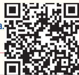
Ссылка на видеоролик

День воинской славы России. День защитника Отечества. В 1918 году была создана Рабоче-крестьянская Красная армия.