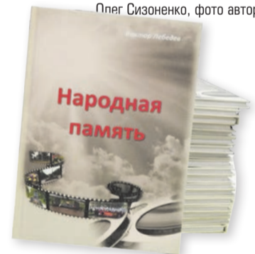
Плег Сизоненко, фото автора

Все представители учебных заведений Ухты получили по экземпляру этого исторического труда, и теперь «Народная память» навсегда займет свое достойное место на полках наших библиотек.