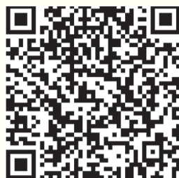
Ссылка на историческую справку

День воинской славы России. День защитника Отечества. В 1918 году была создана Рабоче-крестьянская Красная армия.